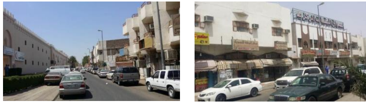
الشكل ٦: ضرورة تطوير منطقة أسواق المیقات (المجاورة للمیقات)