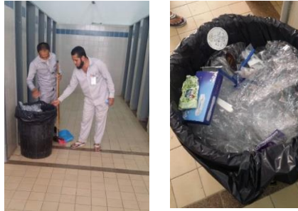
الشكل ١٠: ضرورة تخصيص حاويات للنفايات الطبية والتعامل معها وتداولها بحذر من قبل العاملين