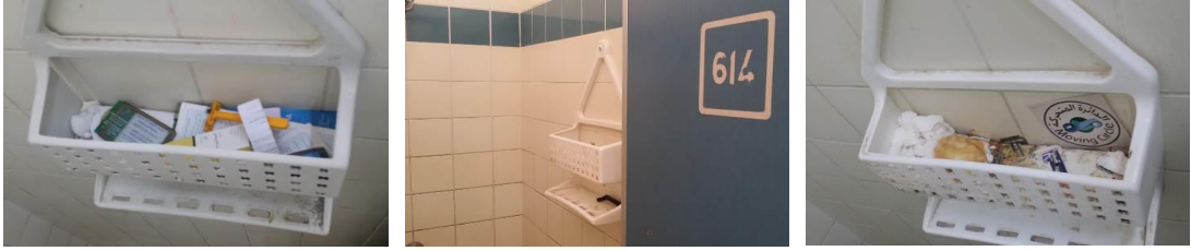
الشكل (٤): توعية الحجاج بعدم ترك النفايات الطبية الخاصة داخل المراوش بالمیقات