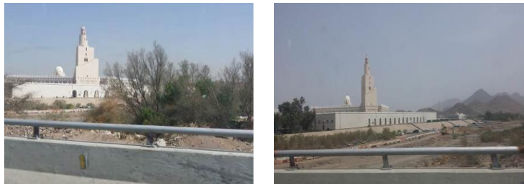
الشكل ٧: ضرورة تأهيل الجانب الشرقي من المنطقة المحيطة بالمیقات