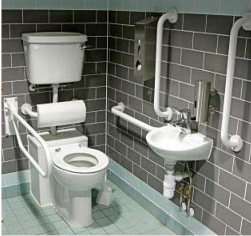
تصور للنموذج المقترح

٣. يجب زيادة نسبة الدورات الصحية المخصصة لذوي الاحتياجات الخاصة ومرعاة ان تتوفر بها فراغات كافية للحركة وتطوير تجهيزاتها وتزويدها بالمستلزمات الصحية ووسائل المساعدة المطلوبة (الشكل ٣).