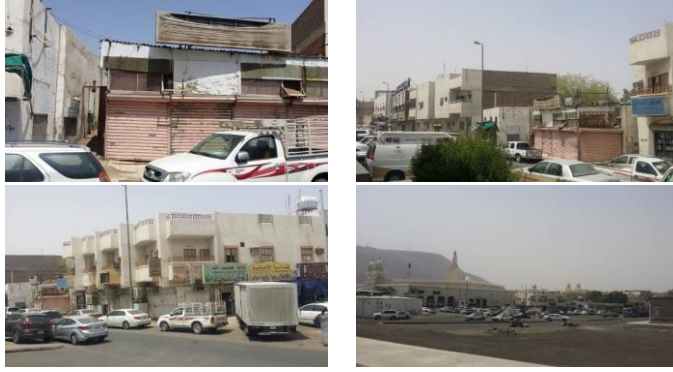
الشكل ٨: نموذج لبعض المباني المجاورة للميقات والموصى بإعادة تأهيلها

١٠. يجب تطوير منظومة إدارة النفايات الصلبة بالميقات من خلال: