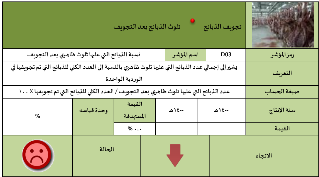
الشكل (٤): بطاقة مؤشر نسبة الذبائح التي عليها تلوث ظاهري بعد عملية التجويف