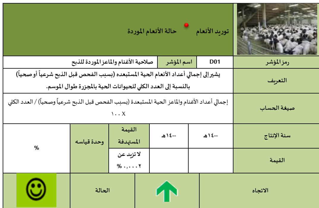
الشكل (٢): بطاقة مؤشر حالة الأنعام الحية المورده للذبح (الفحص الشرعي والصحي قبل الذبح)