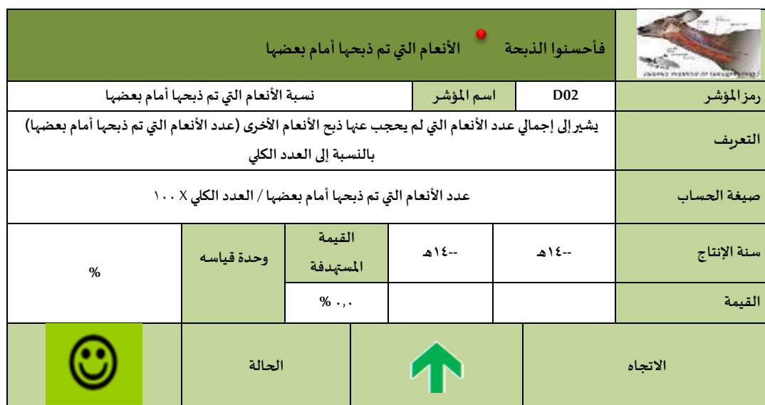
الشكل (٣): بطاقة مؤشر نسبة الأنعام التي تم ذبحها أمام بعضها