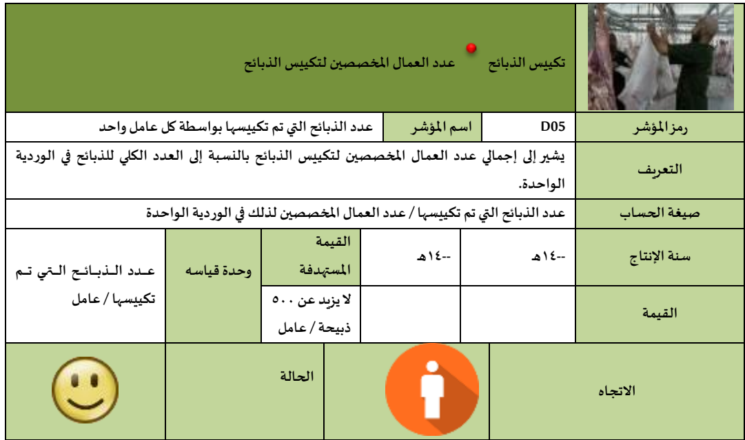
الشكل (٥): بطاقة مؤشر نسبة عدد الذبائح التي تم تكبيسها إلى عدد العمال المخصصين لتكبيس الذبائح

التقدم إلى الأمام (تحسن الوضع الخاص بهذا المؤشر أو المعيار)