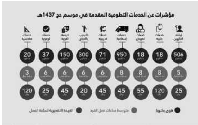
شكل رقم (٣) ملخص للأعمال التطوعية المنجزة بالمدينة المنورة مع عدد ساعات التطوع المسجلة لعام ١٤٣٧ هـ

وقد بلغ إجمالي التكلفة التقديرية لإجمالي العمل التطوعي -الذي يقدم خدماته مجاناً- ما مقداره ٥٥٠.٤٧٨ ريال ويسعى المكتب من خلال التواصل مع الجهات الحكومية والخاصة لرفع مستوى المشاركة في الأعمال التطوعية والتنوع في الخدمة واحتساب ساعات العمل التطوعية للأفراد والقيادات والاستشاريين والتي بلغت ٥٠.٤٧٥ ساعة، بهدف تحفيزهم على المبادرة في الأعمال التطوعية في الحج والعمرة والزيارة.