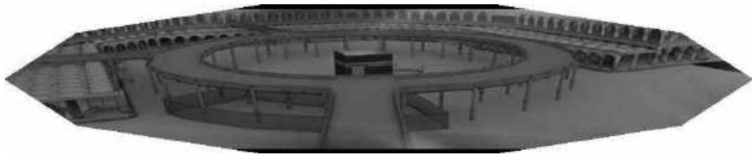
صورة رقم (١)