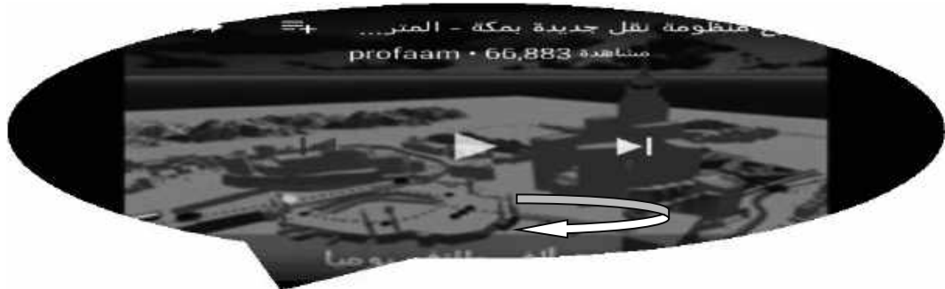
صورة رقم (٢)