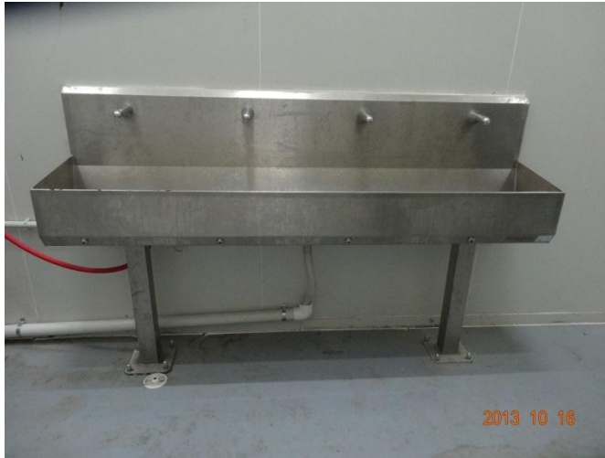
شكل (١٠): نموذج لمغاسل الأيدي قبل الدخول إلى صالة إعداد وتجهيز الذبائح

أما بخصوص سلامة مصدر المياه المستخدم فلا بد من أخذ عينات وتحليلها لإثبات صلاحيتها، حيث تمثل المياه عنصر أساسي على طول خط تجهيز الذبائح. وقد تم تسجيل انقطاع المياه لفترات ليست بقليلة مما أثر على سير العمل ومن المحتمل أن يؤدي إلى مخاطر صحية. وقد ورد في تقرير لجنة الإشراف على التشغيل والشحن بمجزر المعيصم (٤) خلال موسم حج ١٤٣٣هـ هذه الملاحظات الهامة التي ترتبط مباشرة بالإجراءات الواجبة للتحكم في الشؤون الصحية على النحو التالي: