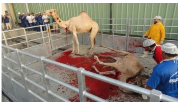
شكل (٦): ذبح الإبل في الوضع واقفاً

كما يتم نحر الإبل في الوضع واقفاً، حيث يمكن للجزار أن ينحر أكثر من حيوان في عمليات ذبح متتالية ويترك الحيوان حتى تنتهي فترة الإدماء، وفي أغلب الأحيان يحدث تلوث لجلد الحيوان بالدماء وبقايا الروث الموجود على أرضية الطبلية المخصصة كنقطة ذبح.