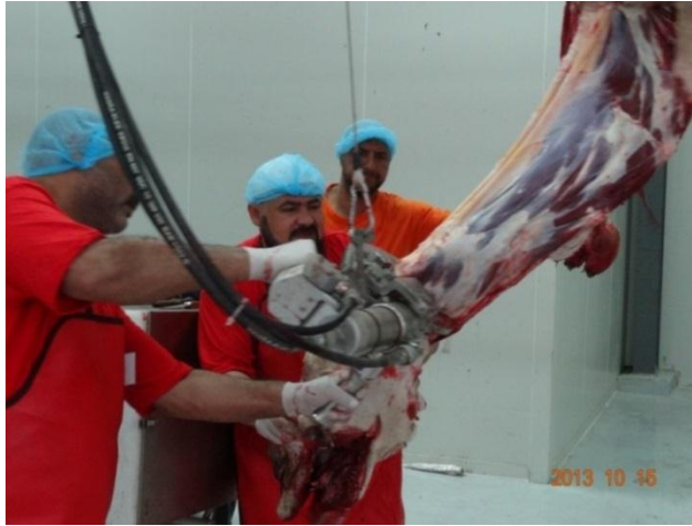
شكل (٤): عدم تدريب العاملين على التعامل مع الأجهزة الجديدة

كما لا يوجد أي توجه لدى الإدارة لوضع خطة تدريبية للعاملين قبل بداية العمل خاصة أن تجهيزات المجزر حديثة وتحتاج بالضرورة لوضع خطة للتدريب عليها. ودير بالذكر فإن الإدارة تستعين بأعداد كبيرة من العاملين في مختلف التخصصات من خارج المملكة ومعظمهم لا يعمل في مجازر تماثل مجزر الجمال والأبقار الحديث مما ينعكس على الأداء وبصفة خاصة على جميع فئات الجزارين المشاركين بالمشروع والعاملين بمجزرة الجمال والأبقار.