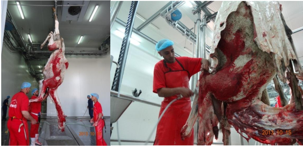
شكل (٨): تلوث جلد الحيوان بالدماء والروث من أهم مصادر تلوث سطح الذبيحة

أيدي العاملين والجزارين التي تلامس وتتعامل مع الذبائح والأعضاء. الشهادات الصحية للعاملين والجزارين حيث وجد من خلال استبانة تم تصميمها لتقييم أداء الجزارين أن معظمهم لا يحملون شهادات صحية مطلقاً وبعضهم يحملون شهادات صحية غير سارية المفعول مما تمثل نقطة تحكم حرجة خاصة إذا كان العامل مريض أو حامل لمسبب المرض. ويمكن لفريق سلامة الأغذية أن يضع الحدود الحرجة لكل نقطة مستنداً إلى قوانين ولوائح سلامة الأغذية بالمملكة العربية السعودية، بالإضافة إلى المواصفات الدولية المعتمدة في هذا الخصوص، حيث يتم مراقبة كل نقاط التحكم الحرجة ومقارنة تلك الحدود قبل وبعد إتمام الإجراءات التصحيحية لكل نقطة.