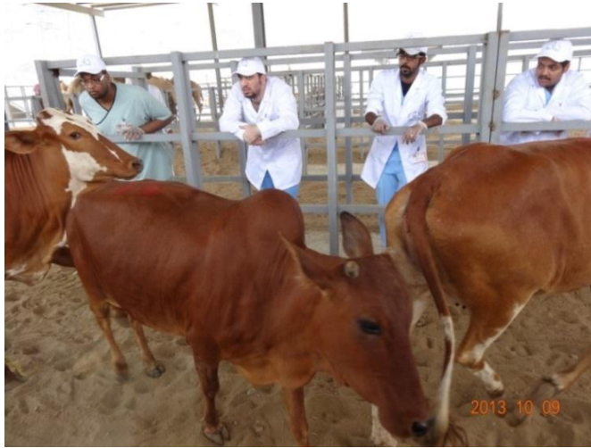
شكل (١): جانب من الفحص الظاهري لجميع الأبقار الواردة للمجزر

ولإيضاح أهمية سياسة الإدارة التي تخص صحة وسلامة الحيوانات الواردة المنتجة للحوم يوضح جدول (١) مثال لأعداد الحيوانات التي تم فحصها يوم ١٤٣٤/١٢/٤ هـ والحالات المرفوضة وسبب الرفض من أجل العمل على سلامة منتج النهائي من لحوم تلك الذبائح. كما يوضح شكل (١) أعداد وأسباب الحالات المرفوضة من حيوانات الإبل التي تم فحصها في ذات اليوم.