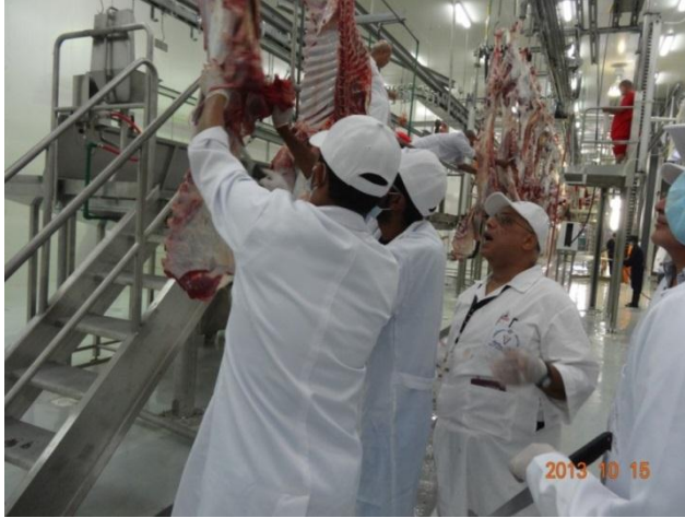
شكل (٣): الفحص الروتيني للذبائح

وامتدادا لتطبيق منظومة السلامة الغذائية خلال جميع المراحل وصولا لذبائح صالحة للاستهلاك الآدمي يتم الفحص الروتيني لجميع الذبائح والأعضاء والحكم على صلاحيتها للاستهلاك الآدمي وذلك يوم النحر وخلال أيام التشريق، حيث يتم إعدام جميع الحالات المرضية سواء المتواجدة في الذبائح أو الأعضاء الهامة مثل الأكباد والقلوب وغيرها.