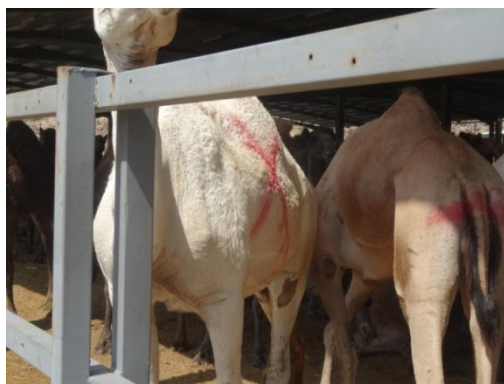
شكل (٧): تهريب الإبل المرفوضة لحظائر المجزر

عدم إجراء الفحص الروتيني لإعداد كثيرة من الذبائح والتي من المحتمل أن يكون بعضها لا يصلح للإستهلاك الأدمي.