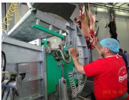
شكل (٥): صعوبة التحكم في البقرة صغيرة الحجم داخل برميل الذبح

تصميمها لخط التجهيز على استخدام برميل الذبح الذي يستخدم في المجازر الأوروبية والأمريكية في ذبح الأبقار. وقد لوحظ تفاوت أحجام الأبقار مما يصعب في بعض الأحيان من التحكم في الحيوان داخل البرميل. أما في حالة دخول البقرة ذات الحجم المناسب داخل البرميل يتم دورانه ١٨٠ درجة لينقلب الحيوان وتصبح رأسه لأسفل وعندها يقوم الجزار بعملية الذبح، حيث يترك الحيوان لإنهاء فترة الإدماء وبعدها يطرح خارج البرميل لرفعه على الخط وتكملة خطوات التجهيز من سلخ وتجويف. ويعتبر إدخال آلية استخدام برميل ذبح الأبقار جديد على المجازر الكبيرة المتواجدة في المملكة العربية السعودية إلا أن استخدامه على خطوط ذبح الأبقار بمجزرة المعيصم رقم (٤) خلال موسم حج ١٤٣٤هـ ولأول مرة واجه بعض الصعوبات في التطبيق مما اضطر لذبح أعداد كبيرة من الأبقار بالطريقة التقليدية خارج البرميل. وعلى الرغم من أن استخدام برميل الذبح في الأبقار محاولة طيبة للتحكم في الحيوان وذبح الحيوان في ظروف بيئية وصحية أفضل بكثير إلا أنها تحتاج لاشتراطات خاصة منها حجم الحيوان والتدريب على استخدام البرميل.