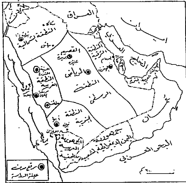
الشكل رقم (١) يوضح توزيع مدن عينة الدراسة بالمملكة العربية السعودية.

والشكل رقم (١) يوضح توزيع مدن عينة الدراسة بالمملكة العربية السعودية.